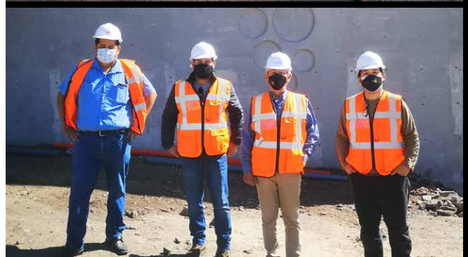
Presentaciones y recorridos por la obra del CEVIT