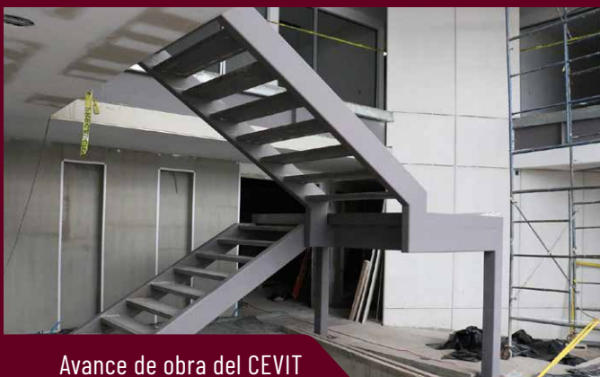
Avance de obra del CEVIT